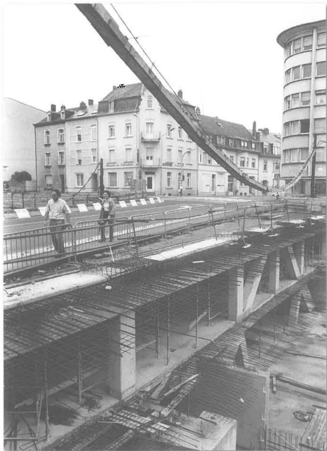
Die neugestaltete Pont de la Concorde • August 1994

nach wenigen Monaten bereits im September, abgesehen von kleinen Arbeiten, fertig. Die Ausarbeitung und der Entwurf der Pläne stammten vom Bezirksingenieur Wirion, die Eisenkonstruktion von der Firma Barblé aus Strassen. Die Brücke selbst wies eine Spannweite von rund 20 Metern auf und hatte eine Höhe von den Bahngleisen bis zum Bogen von 13 Meter. Sie war 14 Meter breit, wovon 9 Meter auf die Fahrbahn und je 2,50 Meter auf die Bürgersteige entfielen. Sie barg in ihrem Innern 15 Eisenträger, die je zwei Tonnen wogen und sie war die erste Brücke unseres Landes, die nach dem Melansystem gebaut wurde. Die Kopfseite war aus Ernzerer Hausteine, von dem annähernd 45 Kubikmeter verwandt wurden, während für die Brüstung 37 Kubikmeter Gilsdorfer Hausteine beansprucht wurden.