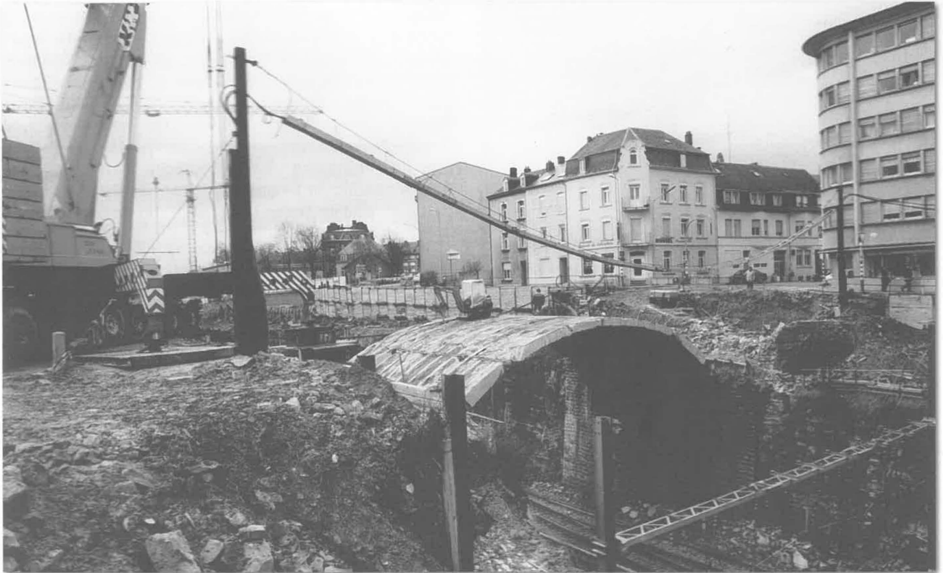
Abriss des Pont de la Concorde • Dezember 1993

In der letzten Nummer der „Nouvelles de Bonnevoie“ haben wir ausführlich über die langwierigen Verhandlungen hinsichtlich der Errichtung der Neippergbrücke auf Bonneweg-Nord berichtet, welche seit 1937 bis zu ihrem Abriss im Jahre 1993 die Verbindung zwischen der „rue des Trévières“ und der Benderstraße, unweit der «Place Wallis» im Bahnhofsviertel, herstellte. Im nachfolgenden Artikel werden wir etwas Näheres über die Ausführung des besagten Bauwerkes sowie über die Einweihungsfeierlichkeiten erfahren, die sich vor nunmehr 70 Jahren, und zwar am 24. Oktober 1937, abwickelten und über die weitere Entwicklung des Bonneweg-Nordviertels berichten.